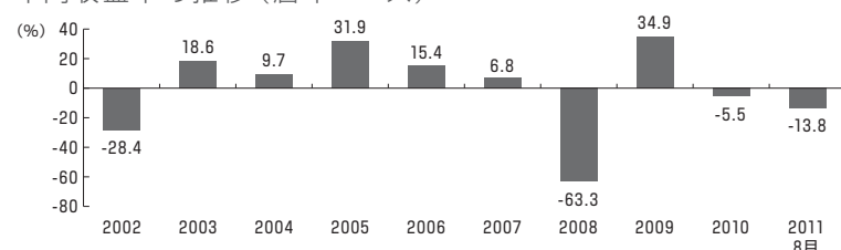
年間収益率の推移（暦年ベース）

当ファンドの収益率は、課税前分配金を再投資したとみなして算出しています。2011年は8月末までの収益率を表示しています。