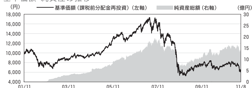
基準価額・純資産の推移

基準価額（課税前分配金再投資）は、課税前分配金を決算日の基準価額で全額再投資したとみなした価額です。税金、申込手数料など考慮しておらず、実際の投資成果を示すものではありません。